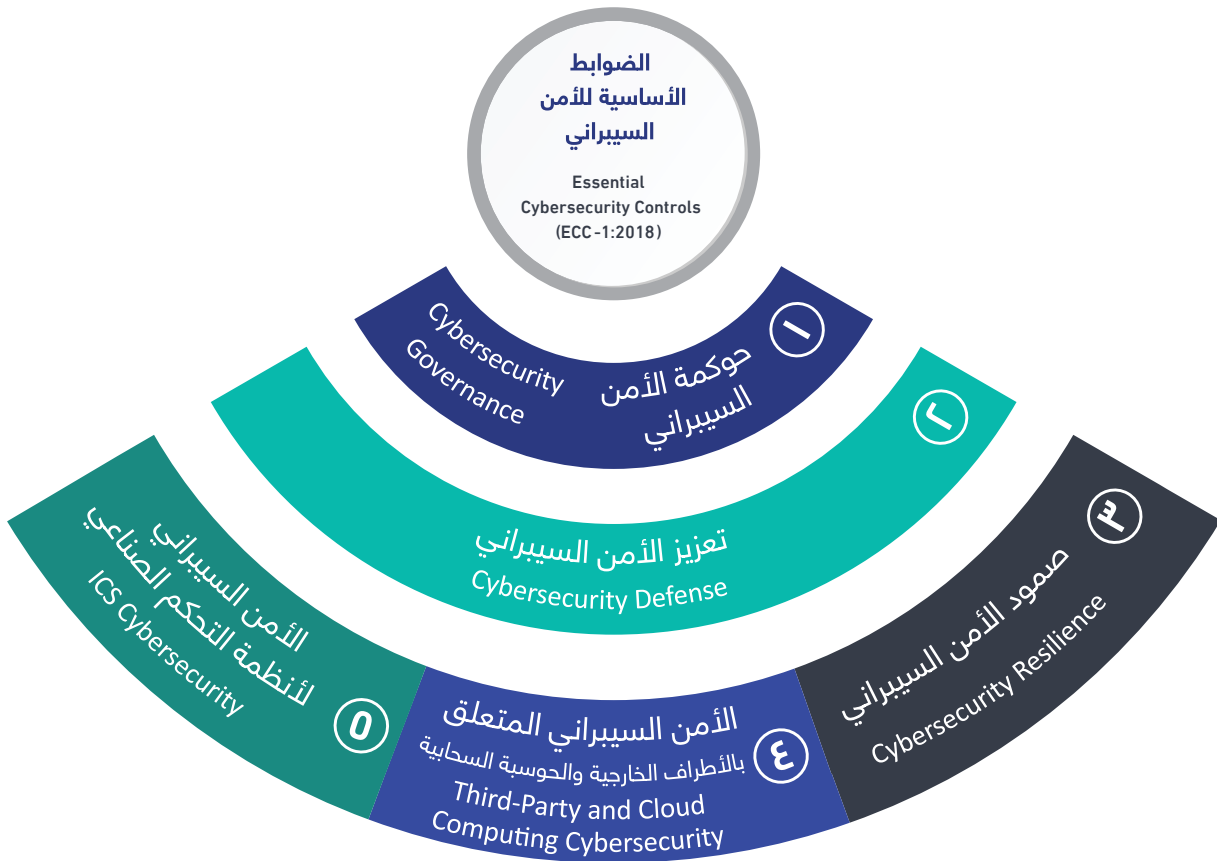
شكل ١: المكونات الأساسية للضوابط

يوضح الشكل ١ أدناه المكونات الأساسية للضوابط.